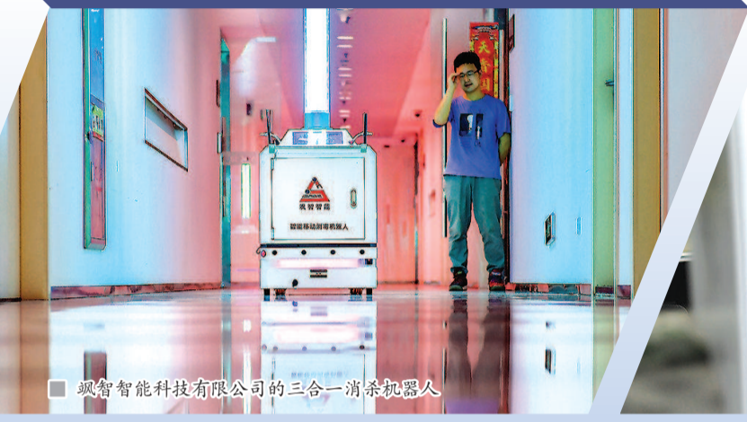
■ 飒智智能科技有限公司的三合一消杀机器人

晚7时，地铁5号线剑川路站旁的商业龙湖天街人气很旺，各家餐厅门口此起彼伏响起“欢迎光临”的迎客声。沿剑川路从沪闵路口往东步行，迎面是走向地铁或商场的上班族人群，他们几乎都来自500米开外马路两侧的园区——零号湾全球创新创业集聚区。 这里，聚集着近500支团队，有近万名年轻人怀揣创业梦想在此打拼。5年以前，除了一家破旧的建材市场和几片旧厂房，此处几乎一片荒凉。而现在，尽管疫情带来的影响尚未结束，这里依旧随处可见热气腾腾的繁忙，随处可见创新创业的“后浪”。最近，零号湾还将和闵行区开展联合招聘，为园区和周边企业吸纳新鲜血液。