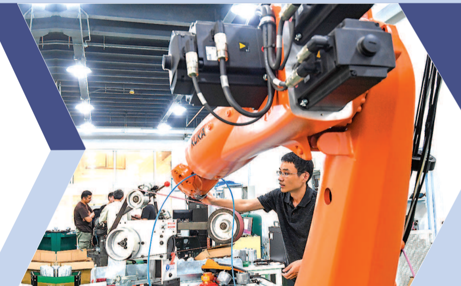
▶ 佳奕彼安机器人科技有限公司的恒力打磨实验室