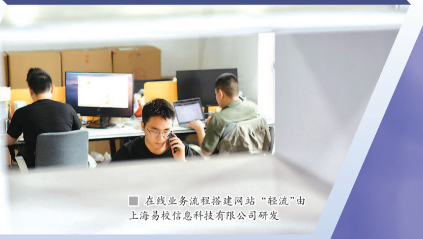
■ 在线业务流程搭建网站“轻流”由上海易校信息科技有限公司研发