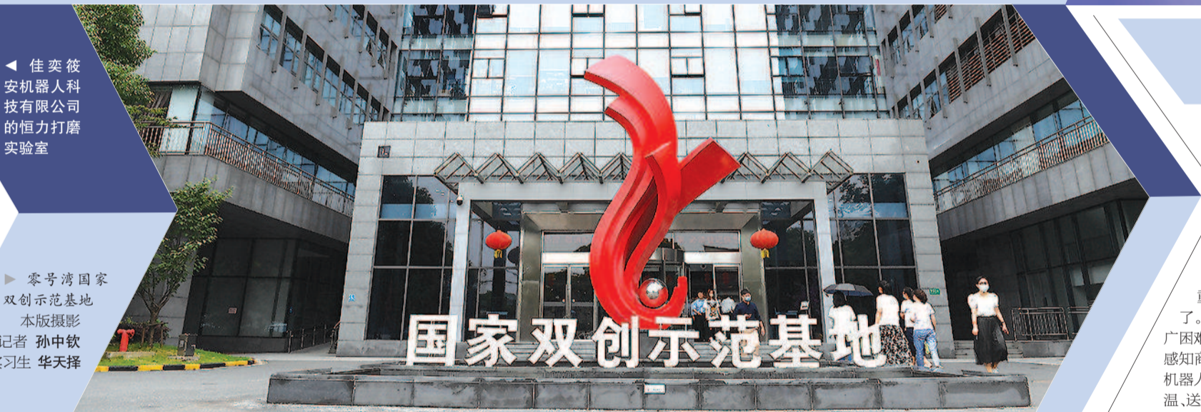
▶ 零号湾国家双创示范基地