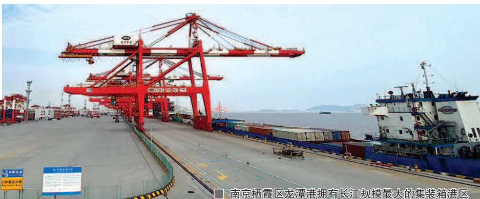
南京栖霞区龙潭港拥有长江规模最大的集装箱港区

新华时评《答好一体化发展“联考卷”》提到,一体化发展没有完成时,只有进行时。今年政府工作报告提出深入推进长三角一体化发展。在这充满希望的季节,长三角这片改革开放热土,必将开创一体化发展的新局面。 本报记者 黄佳琪