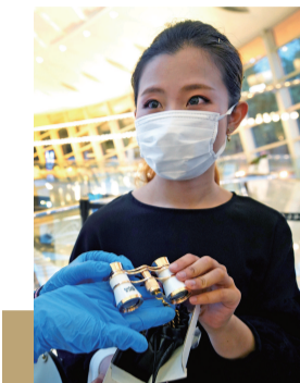
本报记者 郭新洋 摄