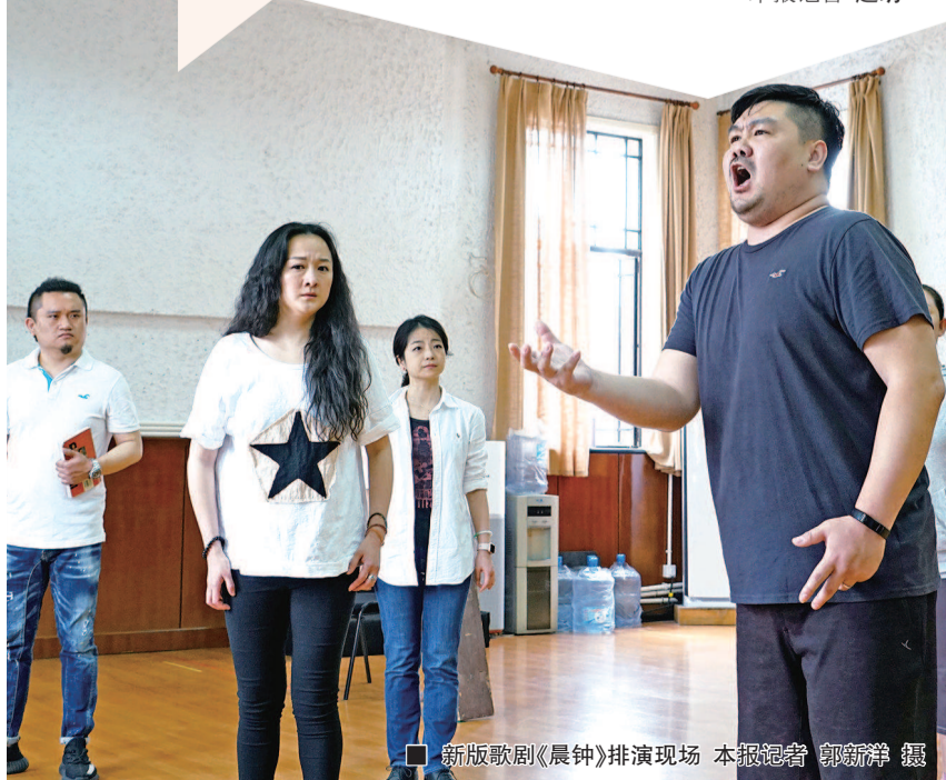
新版歌剧《晨钟》排演现场