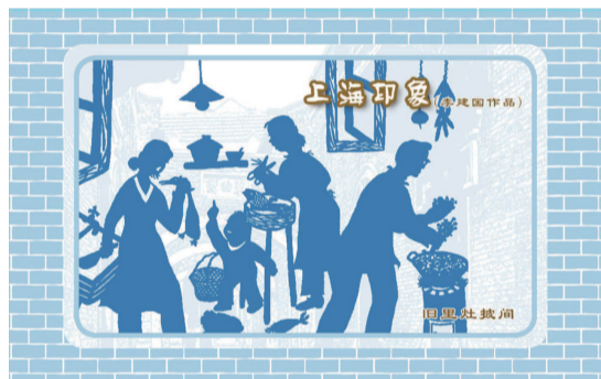
▲ 上海印象·旧里灶披间

近日，我受上海都市旅游发展有限公司和上海交通卡收藏协会之邀，又创作了一套名为《上海印象》限量版的都市旅游交通卡。其中的《弄堂风情》，表现的是里弄居民夏日户外纳凉的温情一刻。《姚周滑稽真幽默》则反映当年里