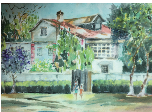
新华路名人故居 (水彩) 周宪法

争争：见信如晤。这大概是我们自认识十年来分离最久的一次，希望你在那边的工作生活如我和萌萌一样安好。