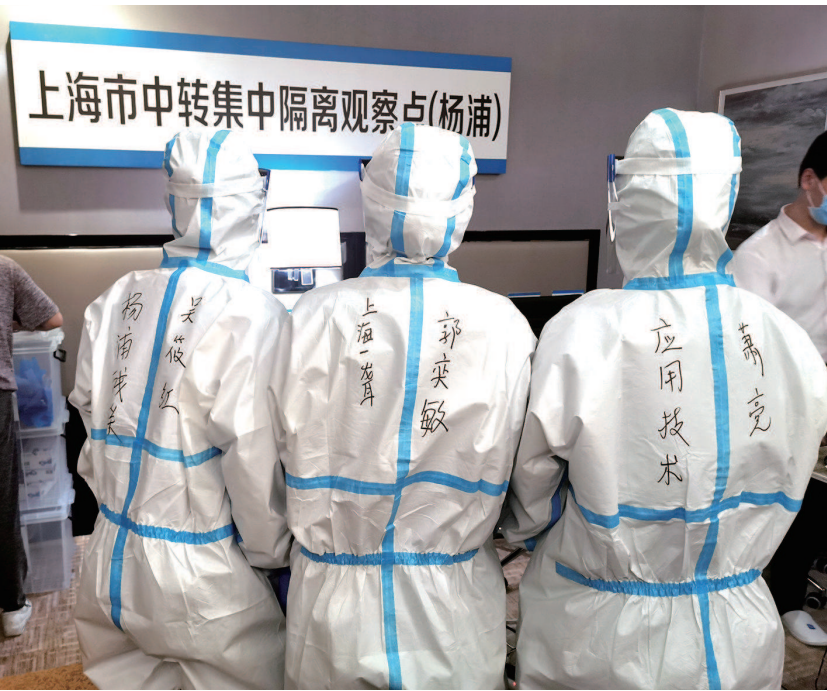
手语翻译志愿者化身“大白”