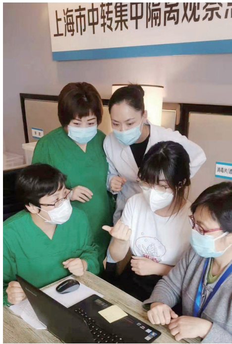
志愿者远程服务聋人

结束隔离观察后,昨晚,16名聋人都已经安全抵达各自的家乡。昨天恰好是第30个“全国助残日”,临别前,驻扎在隔离点的手语翻译为他们一一送上手语祝福。聋人们打着手语表示:“我们很感谢这些天手语翻译和工作人员的贴心照顾,疫情过去后,我们还会再来上海尝尝这里的美食,看看这里的美景……”