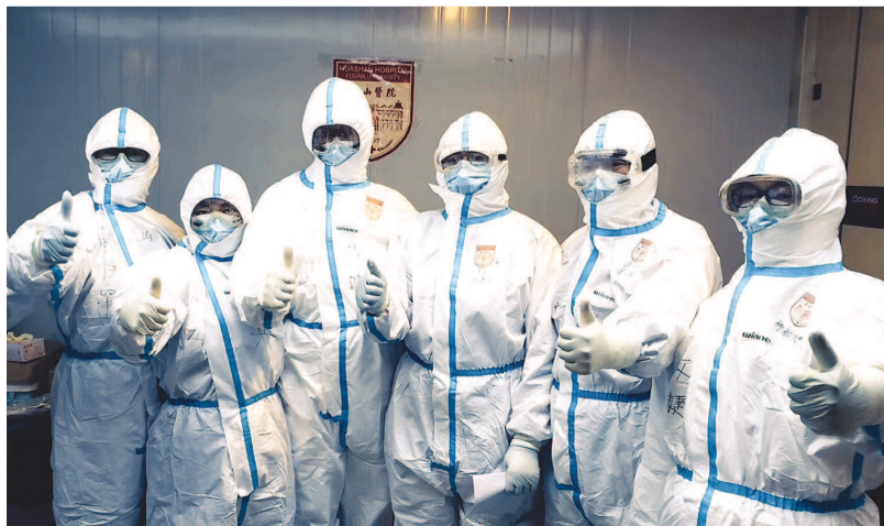
记者与华山医疗队合影