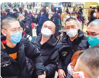
■ 2月9日下午,华山医院214名医护人员集结上海虹桥机场,不少急诊科护士以“卤蛋头”姿态出征武汉