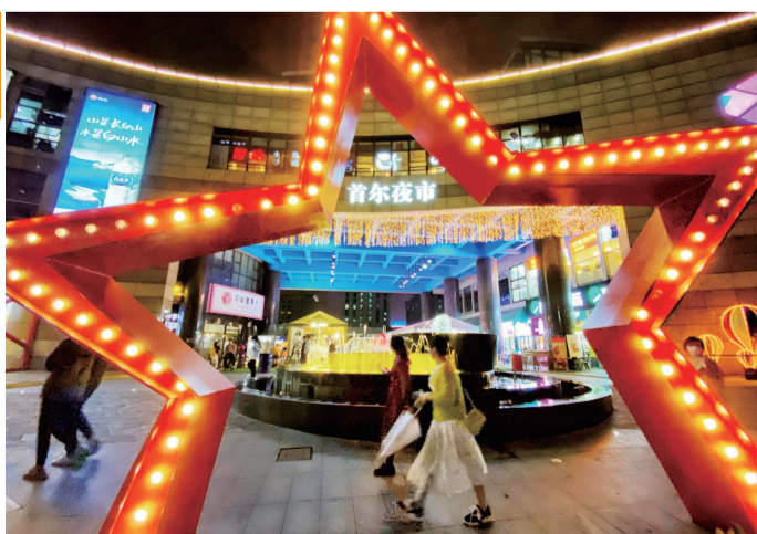
“首尔夜市”四个白色大字高挂在“韩国街”虹泉路的上空，韩式网红餐车和供食客用餐的韩国小吃店透明帐篷沿街摆开，令人仿佛置身于首尔街头……首尔夜市成为闵行购物节经济板块的一大亮点