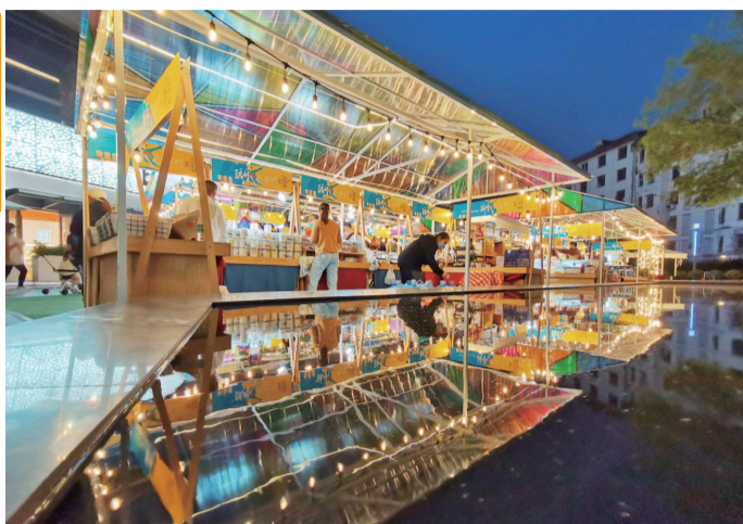
点缀着彩灯的木制凉棚在夜色下显得童话又温暖，这是万科广场打造的台北-上海双城市集，从五一持续到月底，进出广场的市民忍不住在这里逛逛。这里平时会不定期举办主题市集