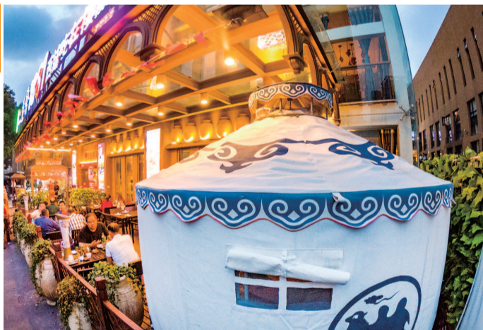
特色小吃、海鲜、烧烤、西餐、啤酒，虹口区“花园夜坊”的美食阵营上线，吸引了产业园区内众多消费者和附近市民前来品尝。这里曾是老工业厂房，而后成为绿色产业聚集区，如今又变身魅力十足的夜市