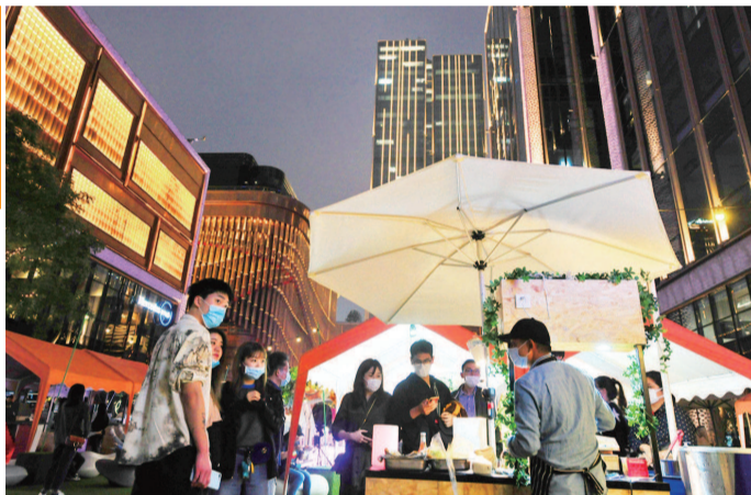
华灯初上，枫泾路上的BFC外滩金融中心周末集市内，一个个摊位汇集成一个人气回归的热闹夜市。这里各种美食、饰品、文创等新奇好物吸引不少年轻消费者纷纷前来“打卡”