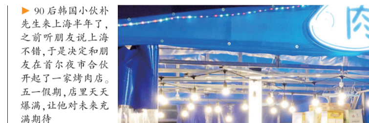
90后韩国小伙朴先生来上海半年了，之前听朋友说上海不错，于是决定和朋友在首尔夜市合伙开起了一家烤肉店。五一假期，店里天天爆满，让他对未来充满期待