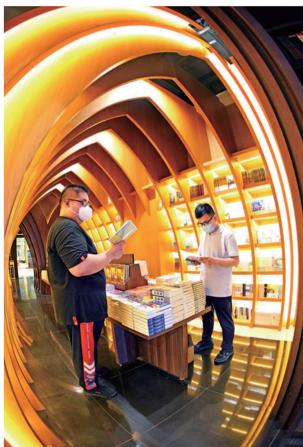
每当夜晚降临，不少年轻人吃过晚饭便来到钟书阁徐汇绿地店选书、看书，书店又恢复了往日的人气。为了配合“五五购物节”，今天起至月底，书店还推出近300种少儿图书5折优惠促销活动