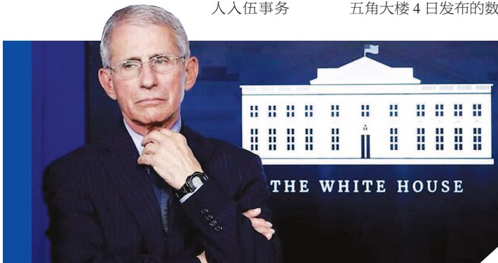
THE WHITE HOUSE

因此,继一度不让福奇现身白宫每日疫情发布会后,特朗普近日又严禁福奇前往国会为抗疫调查作证。“一个人千万不能丢了信