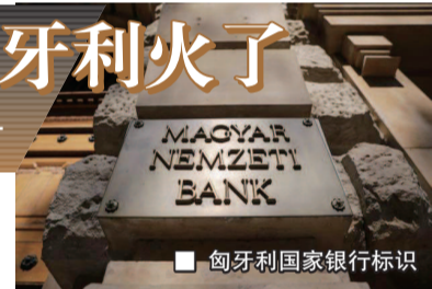
匈牙利国家银行标识

银行客户在注册时绑定电话号码或电子邮件地址的比例几乎一致，用税号注册的比例则为7%。在启动后的第一阶段，银行