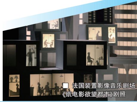
■ 法国装置影像音乐剧场 《纸电影欲望都市》剧照