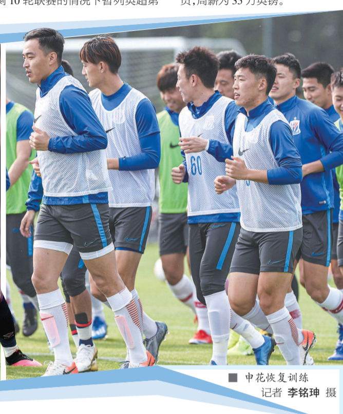
■ 申花恢复训练

各国联赛执行降薪之际,中超也进入降薪节奏。4月9日由中国足协召开的视频会议上,最终决定由足协牵头各俱乐部、球员和教练代表、律师代表起草具体降薪的指导意见。说白了,就是足协明确降薪的方案,俱乐部再来执行。