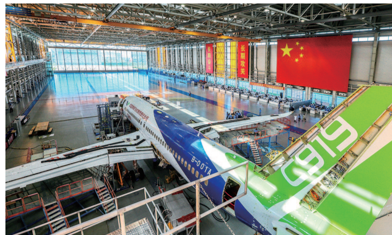
▲C919国产大飞机在浦东祝桥的上海飞机制造有限公司总装车间下线