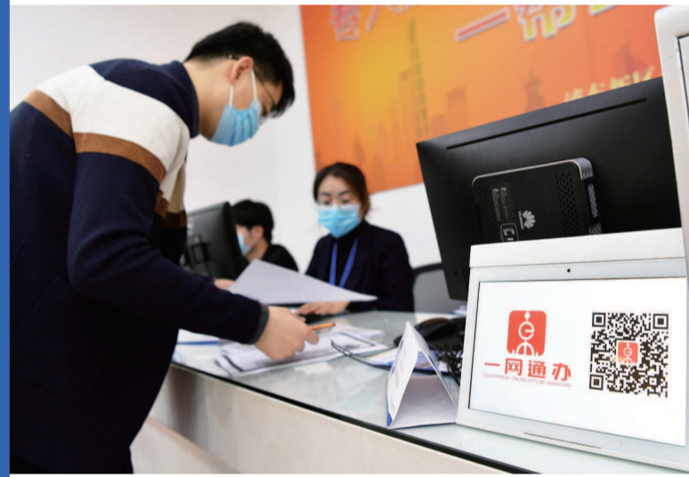
▲浦东“一网通办”打造网上总门户，实现“远程身份核验”和“全程网上办理”，通过“一网通办”“全市通办”及线下“单窗通办”，实现让数据多跑路、让群众少跑腿，一次办成，大大方便市民和企业 本报记者 徐程 摄 ▲最近名叫“花生”的智能送餐机器人很忙碌。这款由浦东金桥企业上海擎朗智能科技有限公司研发的机器人系列产品已经在国内许多餐饮企业投入实际运行，助力餐饮行业建立“无接触配送”体系，加快复苏脚步。同时，“花生”们还奔赴抗疫一线，以无接触形式在医院、集中隔离区完成送餐、送药任务，成为白衣天使们的战“疫”好帮手 本报记者 徐程 摄