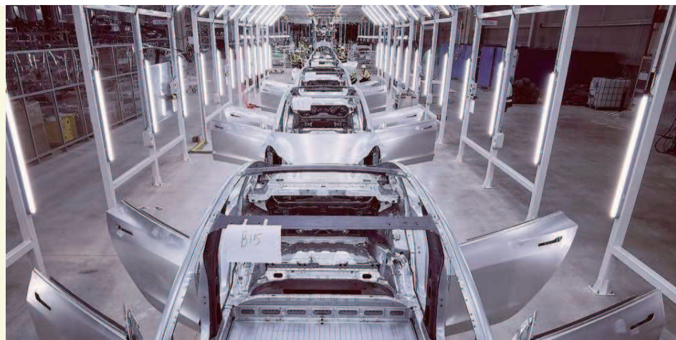
▲本月，特斯拉中国宣布特斯拉Model 3长续航后轮驱动版与高性能全轮驱动版正式开放预订。这意味着位于上海临港的特斯拉超级工厂将生产Model 3在售的所有车型

美好生活浦东造！这些蕴含着高科技和创新力的“硬核”产业，已经成为助力上海发展的引擎，最终将提升人们的生活品质和福祉，让我们的未来更美好。