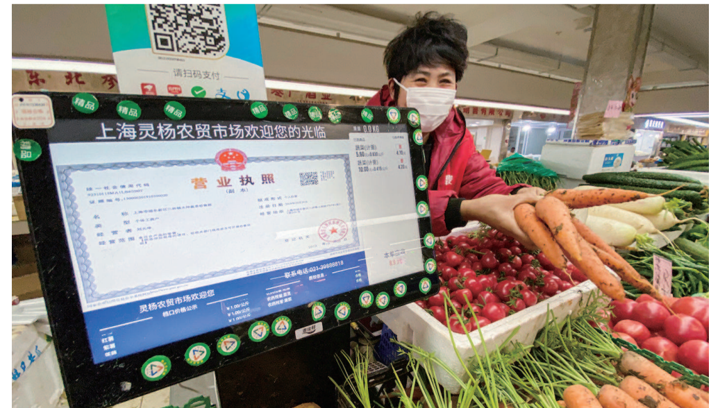
▲上海灵杨智慧菜场是浦东首个智慧菜场。今年元旦正式运营以来，通过互联网+、大数据为智慧农贸提供技术支持，实现了智慧管理、智慧监管、智慧公示、智慧分析的方式经营。秤上显示价格、证照、食品检验检测等信息