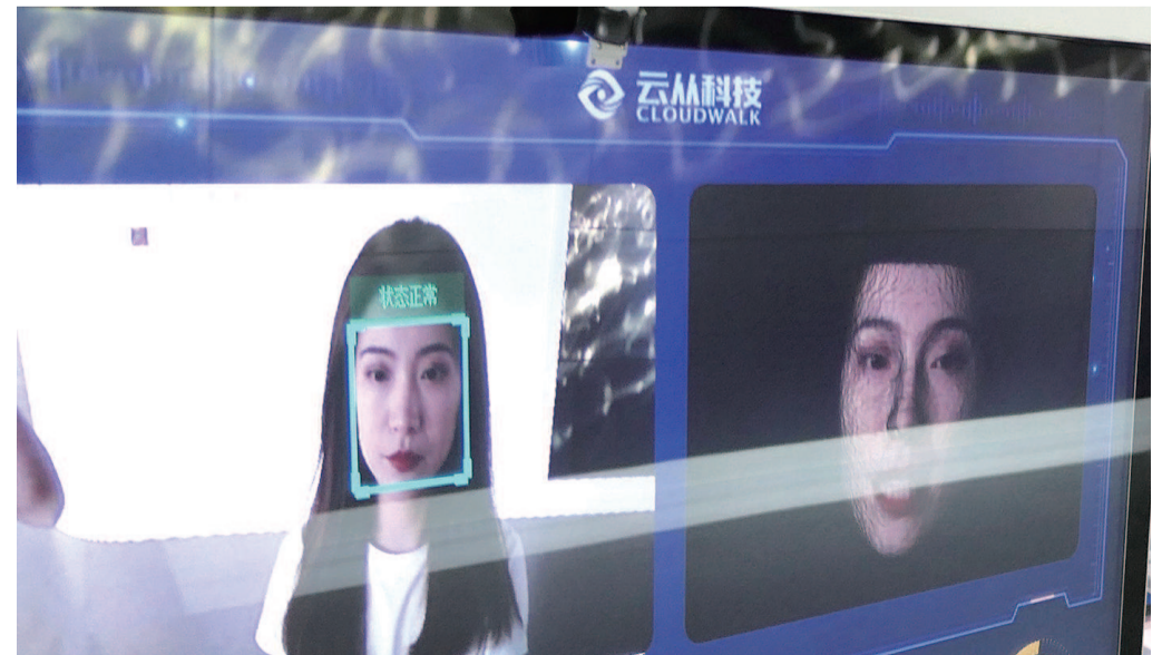
▲位于张江的云从科技研发的3D结构光人脸识别技术能够更好地提升安全性，将深度信息与其他局部特征作为深度网络的输入，保留了更多的三维模型信息，识别效果相比可见光人脸识别大大提升，广泛适用于银行等行业