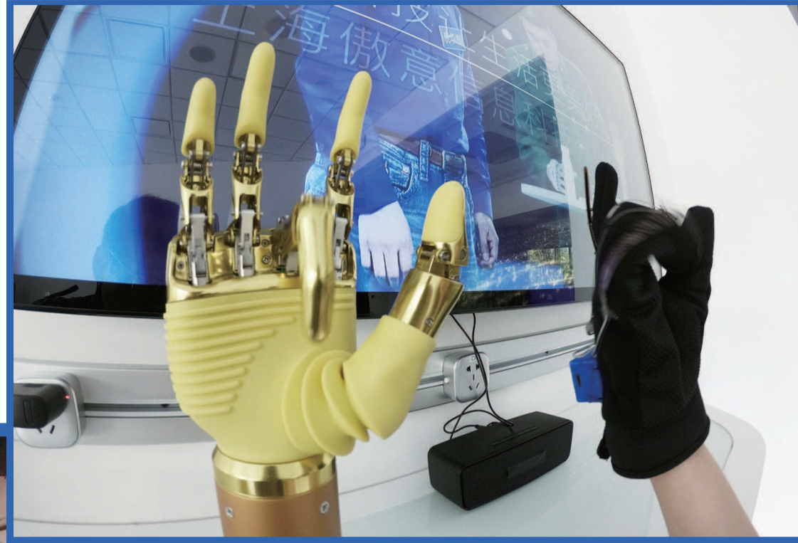
▲在胳膊上戴上一个臂环，将臂环连上专门的电脑程序，人手做出的相应动作就能实时投射到机械手上。傲意科技的智能肌电仿生手有280多个零件，高度还原了人手功能，还能不断学习“肌肉语言”，做到零延迟。仿生手还配置了比常规肌电义肢多4倍的传感器。基于这些强大的特性，失去手掌的残疾人戴上这只“手”后，可以举杯喝水、运笔写字