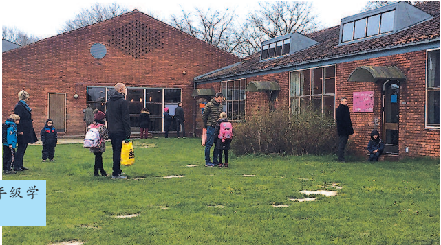
▶ 丹麦小学低年级学生已经开始复课