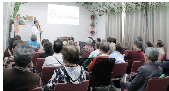
往届“保松牙科普现场”

新民健康工作室特联合知名中老年口腔机构院长、专家，为饱受松动牙、缺牙困扰的叔叔阿姨们带来面对面线上口腔健康指导建议，科普先进的保松牙理念。