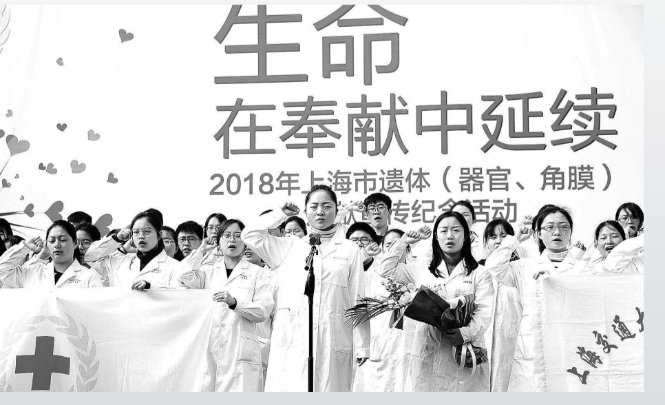
▲每年3月举行的上海市遗体捐献（器官角膜）宣传纪念活动

70年前，人民解放军第三野战军发起解放上海战役。这支由新四军逐步改编扩建而成的人民军队，在解放上海战役中英勇无畏所向披靡。接管建设新上海，新四军南下干部任劳任怨无私奉献。上海城市历史的每一个脉搏都留下过新四军的印记，铁军精神早已融入城市血脉。 2005年，上海福寿园与上海市新四军历史研究会协作，出资兴建了上海新四军广场，占地5500㎡的广场，松柏环绕，绿草如茵。一面长达88米的纪