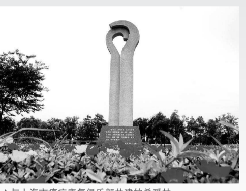
▲与上海市癌症康复俱乐部共建的希爱林