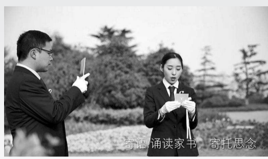
高洁诵读家书 寄托思念

非常时期，非常清明。在云端，让我们共祭。 清明，云共祭——追忆先人，致敬先烈先贤，缅怀这场战“疫”中所有的英雄和罹难者。我们向每一个远行的生命庄重行礼。这是对生命的共同回忆，是对历史的深刻铭记。 清明，情深意长，我们追忆园内长眠的先人。鸟儿飞过天空，留下鸣声。逝者已去，此地安祥。 今天，云共祭，为他们唱响生命之歌，灿烂或质朴，恰如他们的人生。 清明，家国同祈，我们致敬先烈先贤。他们前赴后继，壮怀激烈，为国捐躯。他们报效祖国，襟怀品格，日月同光。 今天，云共祭，致敬先烈先贤，不负万山河。 清明，齐心战“疫”，我们缅怀抗疫殉职的英雄、不幸感染离世的遇难者，还有因这场疫情而无法好好与这个世界告别的逝者。这伤痛，我们铭刻于心。 今天，云共祭，向英雄致敬，向苦难致哀，生命就此定格，记忆在此追念。 这一刻，让我们在福寿云云端共祭，不忘过往，珍视当下，开启未来。