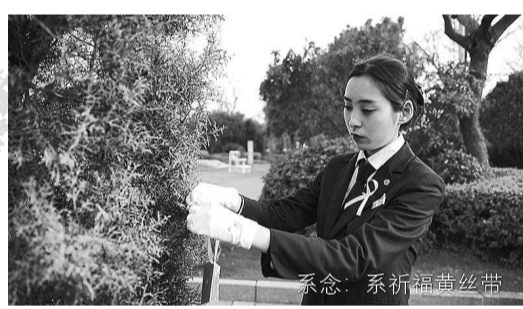
系念 系祈福黄丝带