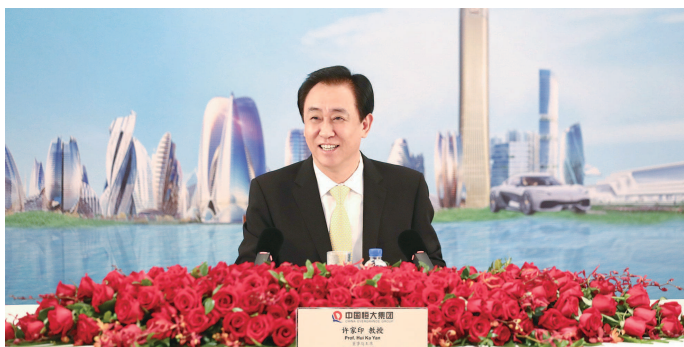
▲许家印宣布恒大全面实施新战略

此言非虚。即使在今年一季度受到新冠肺炎疫情影响,恒大产品凭借明显的品质和性价比优势,实现互联网逆势畅销。数据显示,受益于网络销售,一季度,恒大销售额大增23%至1465亿,销售回款大增55%至1133亿,均为行业第一,并刷新公司一季度销售及回款最高历史纪录。这一“开门红”业绩彰显恒大实施新战略的成效。