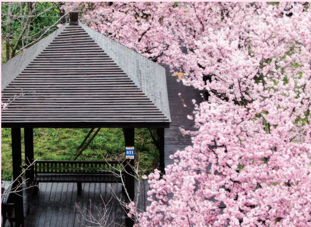
一个月前早樱盛放时, 顾村公园里空无一人