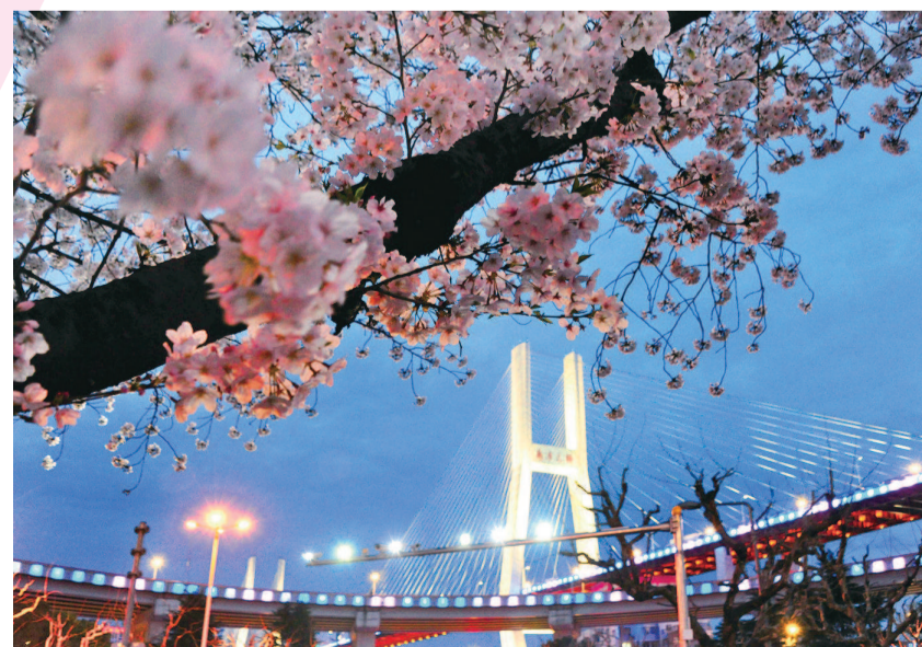
南浦大桥交通枢纽站的樱花与大桥的灯光融为一体, 增添了夜色的浪漫