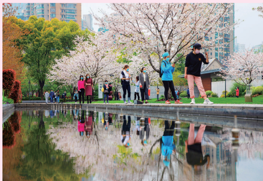
盛放的樱花吸引着市民纷纷来此享受春光