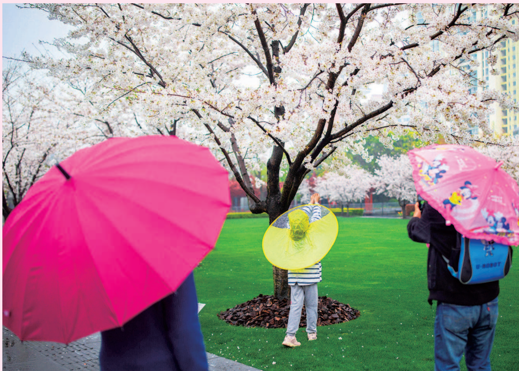
静安雕塑公园盛放的染井吉野樱如枝头傲雪。白花配红伞, 再拗个可爱的造型, 定格下春天的美好