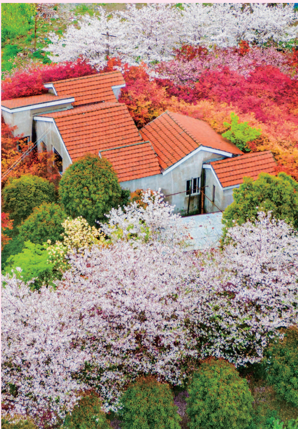
青浦区金泽镇西岑社区 200 亩樱花花海如云似雪, 红叶娇艳似火, 相互映衬, 美景如画