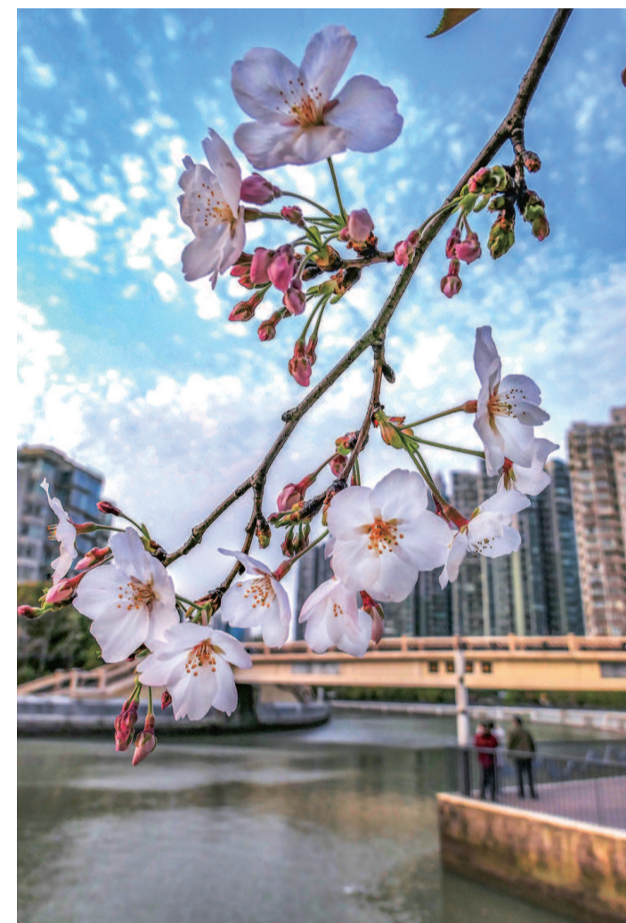
苏州河畔盛放的樱花吸引着市民来此观赏, 享受春光