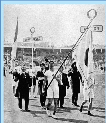
■ 1912年日本首次参加奥运会