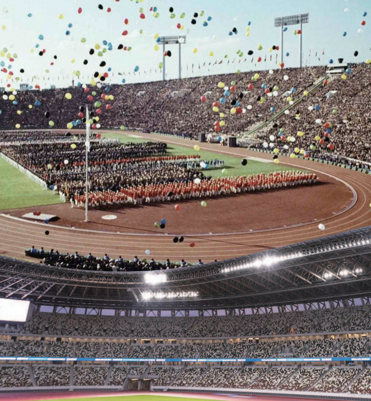
■ 为2020年东京奥运修葺一新的国立竞技场