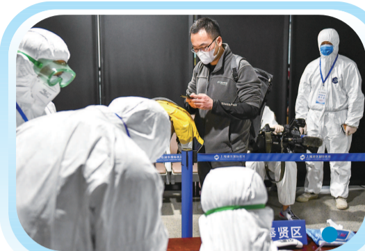
21 15 小耿来到浦东机场奉贤区点位登记核对信息