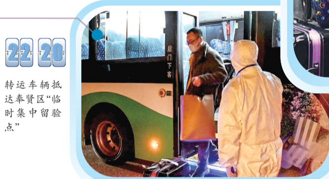
22 20 转运车辆抵达奉贤区“临时集中留验点”