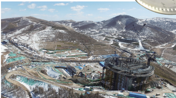
国家跳台滑雪中心建设现场

按照国际奥委会、国际残奥委会的要求,在每届奥运会和残奥会正式举办前10到24个月期间,所有比赛分项都要举办测试赛。作为北京2022年冬奥会的第一场测试赛,2019/2020国际雪联高山滑雪