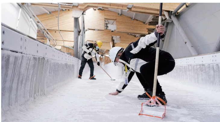
工作人员在国家雪车雪橇中心赛道上制冰