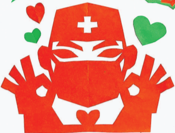
中国·奥利给 李诗忆 2020年1月27日于上海