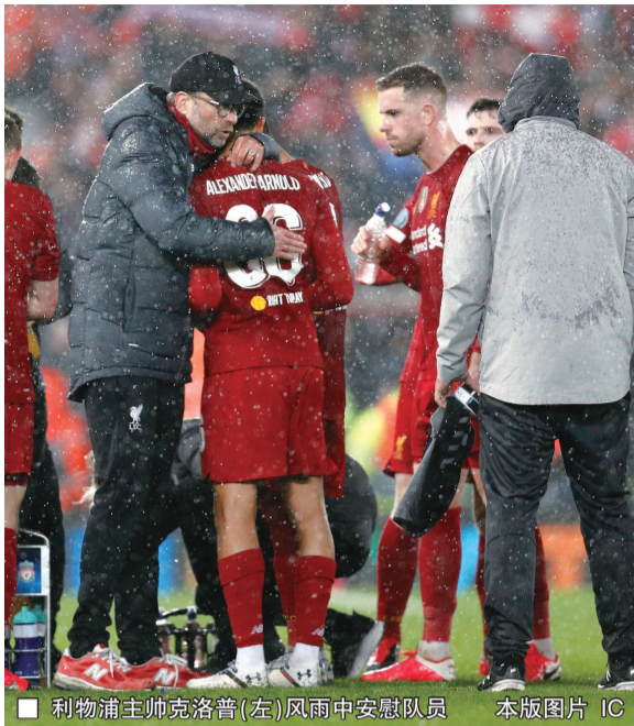
利物浦主帅克洛普(左)雨中安慰队员