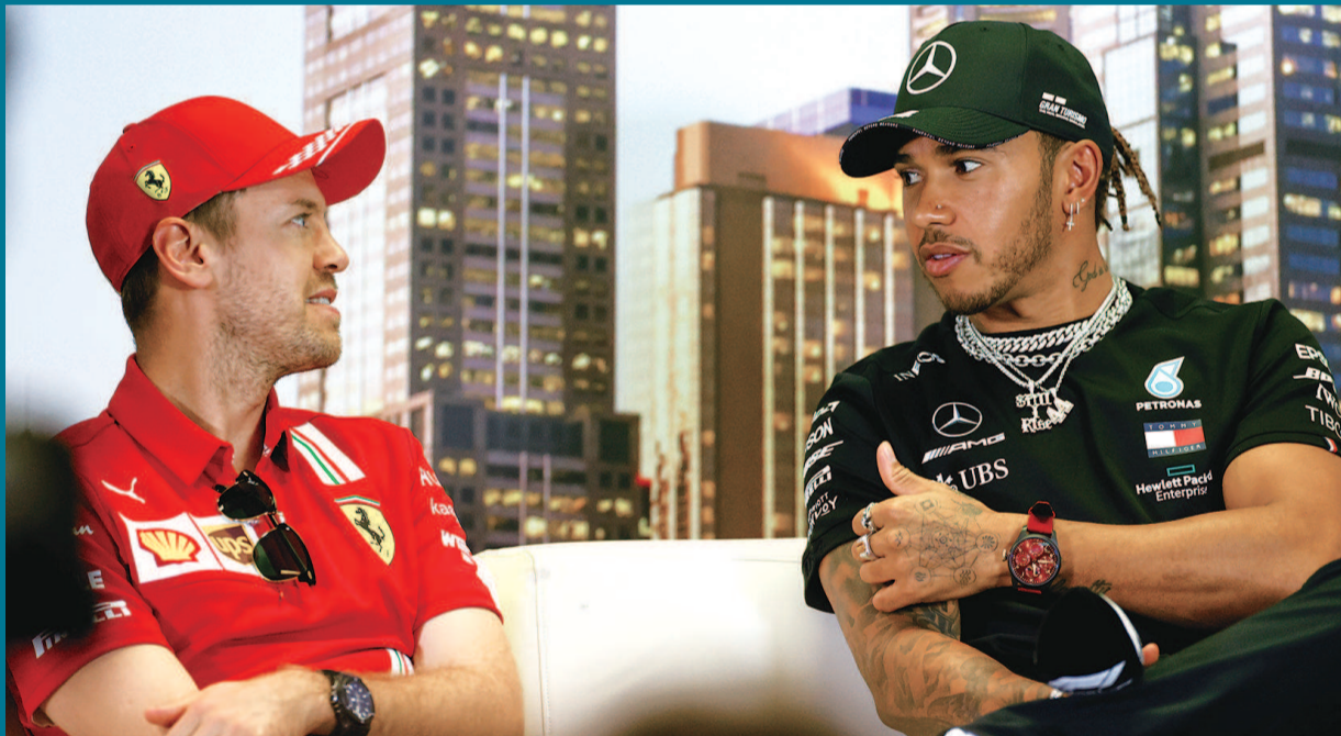
■ 汉密尔顿问法拉利车手维特尔(左):意大利“封国”了,你们车队回哪?(设计台词)

疫情面前,按下暂停。在公众健康和生命安全面前,比赛必须让步,这是任何一个有担当的赛事组织都应该做的。在生命面前,无论何种赛事、任何经济考量,都应该让步。