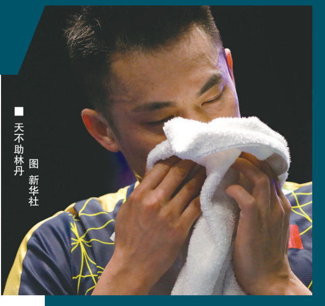
■ 天不助林丹

由于停赛会对许多正处于奥运资格边缘的球员带来不利影响,世界羽联是否会考虑延长奥运积分赛周期,目前还没有任何说法。世界羽联将会对奥运积分的最新规定发布进一步的公告。