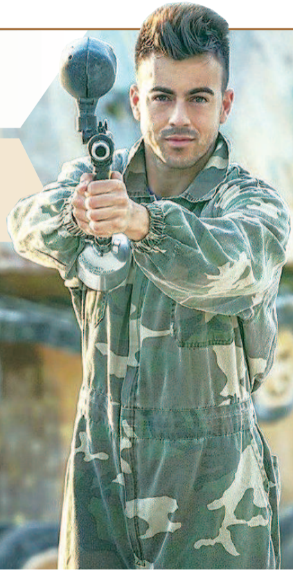
沙拉维为战“疫”贡献力量