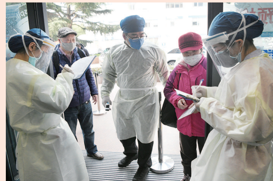
医院防线 ▲ 2月25日,病人进入同仁医院发热门诊要经过测温、流调、出示流调结果再测温三道“门檻”。发热门诊是抗击新冠肺炎的第一道防线