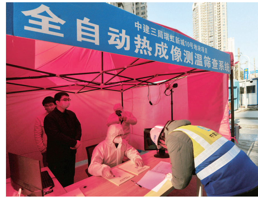
工地门禁 ▲ 2月21日,虹口区中建三局瑞虹10号项目当天起复工。现场设置了一条入场“流水线”,施工人员通过实名制人脸识别门禁、全身消毒、扫码填报健康信息,穿过全自动热成像测温筛查系统覆盖的通道后才能进入工地