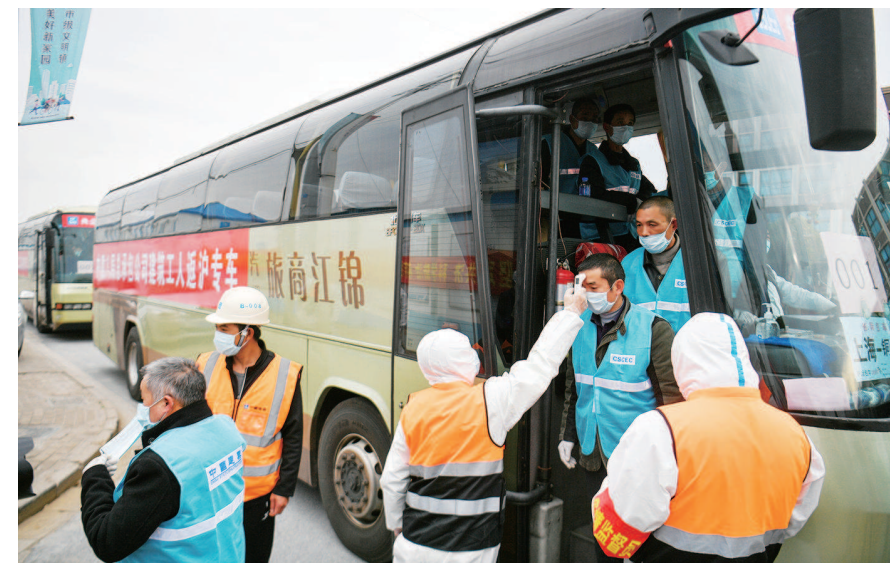
复工包车 ▲ 2月21日下午3时半左右,两辆车头放置着“001”号牌的大巴从安徽返回上海,这是中国建筑第八工程局工人的返沪专车,也是上海首例从外地接回在建工程务工人员包车。上海市道运局按照“特事特办、急事快办”原则,确认符合条件后,马上开通了上海市第一张“点对点”省际包车标志牌