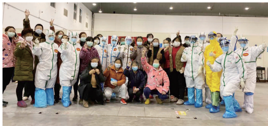
昨天,武汉客厅方舱医院132名新冠肺炎治愈患者走出医院