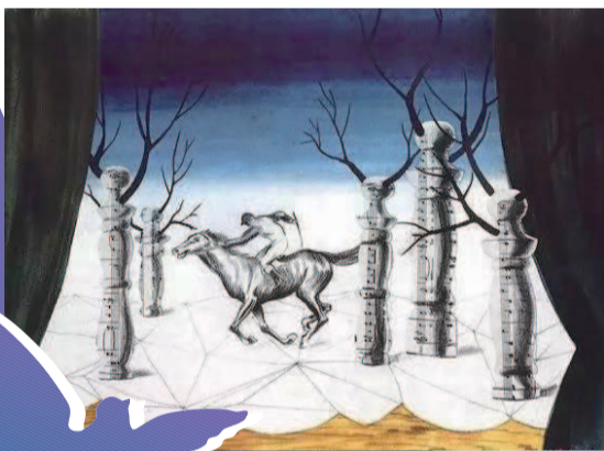
第一幅超现实主义作品《迷失的骑士》