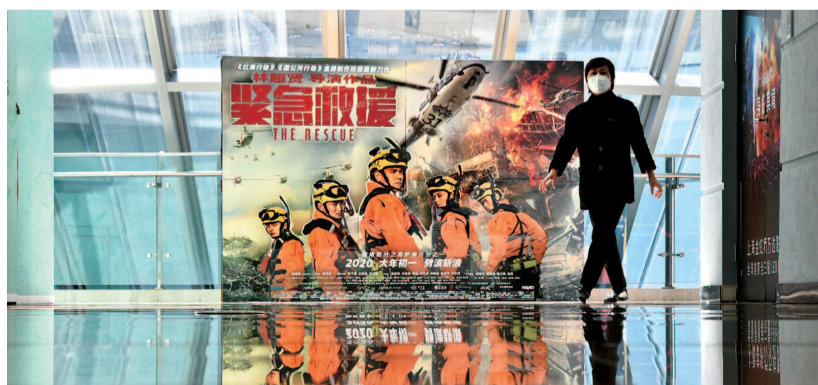
■ 今天上午,位于娄山路上的金虹桥万达影城依然闭门谢客

疫情发生后,上海全市电影院暂停营业,收入受到很大影响。扶持上海文化“20条”中提出,将“精准实施影院补贴政策”。相关补贴将如何进行?相关部门负责人表示,