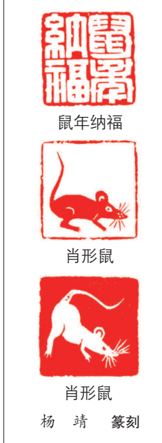
鼠年纳福 肖形鼠 肖形鼠 杨靖 篆刻