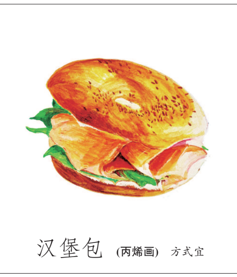
汉堡包 (丙烯画) 方式宜

至于我自己的作品,我不关心它们明天会怎样,今天拥有众多读者就可以了。我从来都不认为我的作品有传世的价值,因此也绝不追求这个目标。我一再说,我的作用仅在于把读者引到经典作品面前,我不会无知和自信到认为我的作品能成为经典。我二十多年前的作品现在仍有许多人喜欢读,这个情况已经大大超过我的期望了,为此我既感到满意,又感到惭愧。