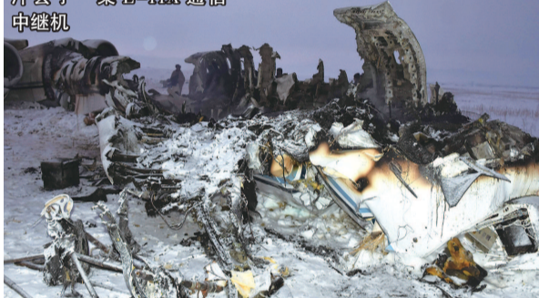
美国空军确实在阿富汗丢了一架 E-11A 通信中继机