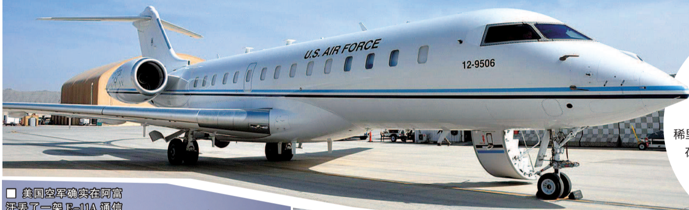
美国空军的 E-11A 通信中继机

自从 1 月 27 日美国一架 E-11A 飞机摔入阿富汗塔利班控制区, 导致机上人员死亡后, 外界就传闻不断。尤其好莱坞明星弗雷德里克·莱恩稀里糊涂地被“误伤”, 他的照片出现在伊朗电视台新闻节目中, 说他是坠机事件中的死者之一, 而且身份是“中央情报局高官”。这究竟是怎么回事呢?