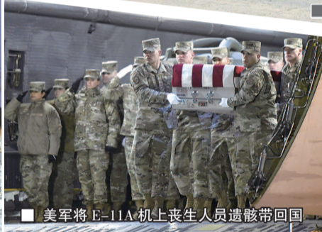
美军将 E-11A 机上丧生人员遗体带回国

2012 年, 莱恩出演电影《猎杀本·拉丹》里的中情局高官, 代号为“狼”, 专管暗杀。而“狼”的原型则是首创用无人机“斩首”的中情局超级特工迈克尔·达安德里亚。今年 1 月 28 日, 伊朗多家电视台援引俄罗斯情报部门的消息, 称达安德里亚就在那架坠毁的 E-11A 飞机上, 由于媒体一时找不到此人的照片, 于是莱恩的剧照就“荣幸”地变成达安德里亚的“代言人”。