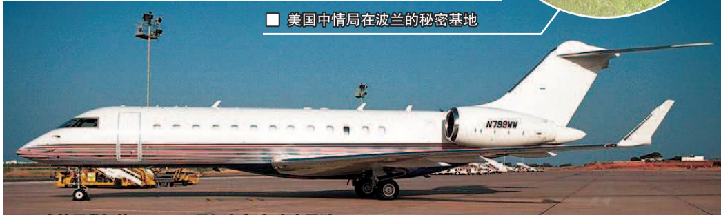
中情局掌握的 N799WW 号机充当过“空中黑狱”