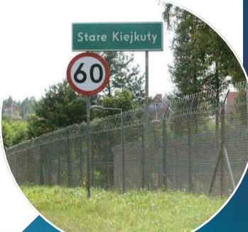
美国中情局在波兰的秘密基地

BACN 处于运行状态, 确保美军中央司令部各军兵种间数据互联互通, 这也难怪, 掉了一架 E-11A 后, 美军上下伤心不已。当然, 鉴于美军和中情局的紧密合作关系, E-11A 飞机上出现中情局人员也并不稀奇。