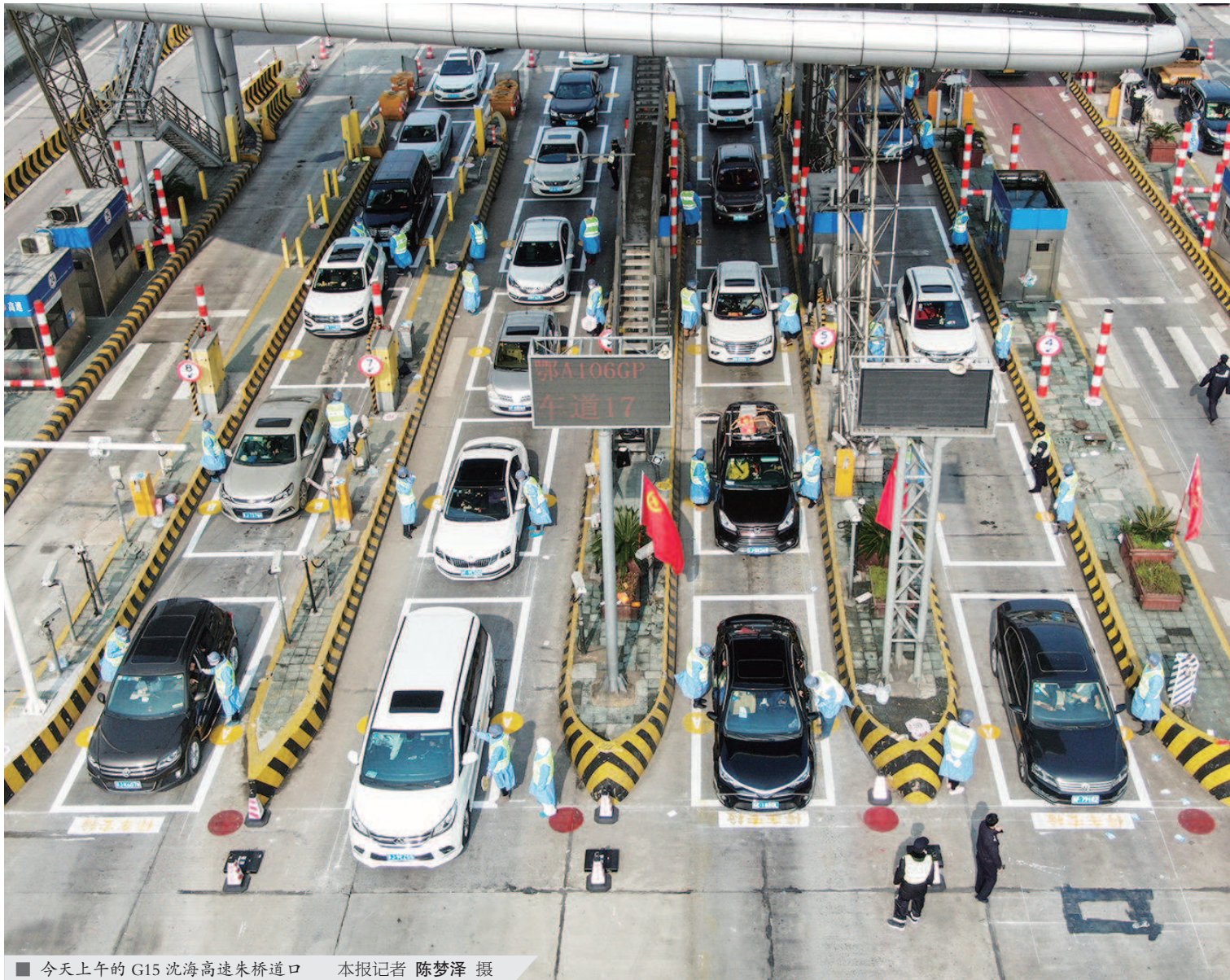
■ 今天上午的G15沈海高速朱桥道口

经过进站服务窗口时,张开凯与里面的彭晓颖相视一笑——他俩是夫妻,共同坚守防疫第一线。