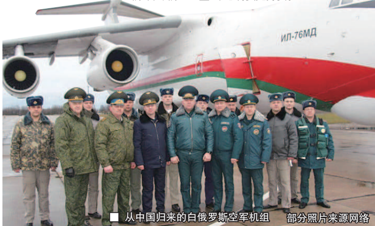
■ 从中国归来的白俄罗斯空军机组

1月31日，俄罗斯总统普京致电中国国家主席习近平，就中国爆发疫情表示同情，并表示愿意援助中国。次日，两国外长通电话，提及中方欢迎俄方派防疫专家代表团来华交流，开展疫情防治等公共卫生合作的内容。俄罗斯卫星通讯社报道，为帮助友好国家抗击新型冠状病毒肺炎疫情，俄罗斯已向欧亚经济联盟成员国提供病毒诊断试剂。该试剂来自俄联邦消费者权益及公民平安保护监督局所属“矢量”中心，那是俄罗斯最高端的病毒学机构，曾研制出本国第一个艾滋病病毒和乙肝病毒诊断试剂，第一个组织生产了人基因工程干扰素——a-2，研制出具有抗病毒包括抗流感活性的里多斯汀药剂，为抵御全球性传染病威胁提供科研和实践保障。俄媒体普遍认为，如果受领赴华合作任务，“矢量”中心将责无旁贷。