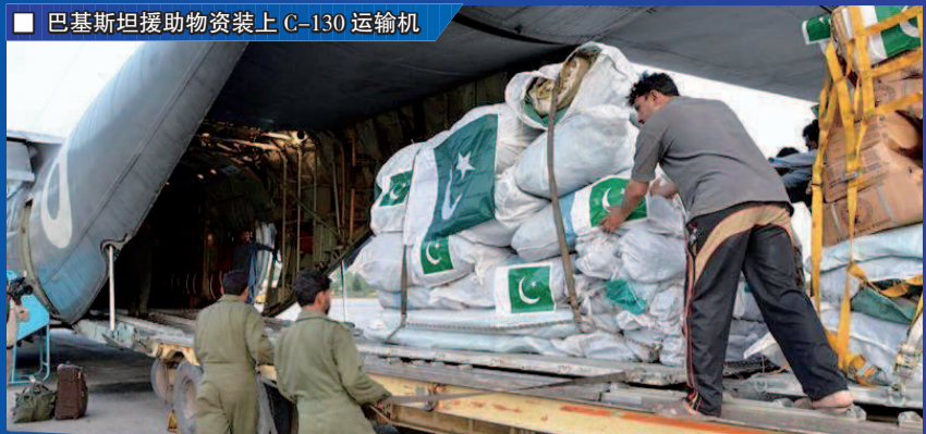
■ 巴基斯坦援助物资装上 C-130 运输机

“我是只身回国，行李都留在武汉，因为我盼望早日再去那里。”仁川国际机场，53岁韩国人老金走下包机，匆匆跟记者说了这一句，便前往指定隔离所，接受医学观察……这是韩国政府于1月底用包机从武汉接回侨民的场景，但这些包机并非“空机前往”，它们是带着援华医疗物资上路的。“我们将不遗余力与中国共克时艰。”韩国总统文在寅说。 中国外交部发言人华春莹表示，新型冠状病毒肺炎疫情影响发生后，一些国家通过不同方式向中方表达抗疫理解和支持。“患难见真情。”华春莹给予这样的评价。