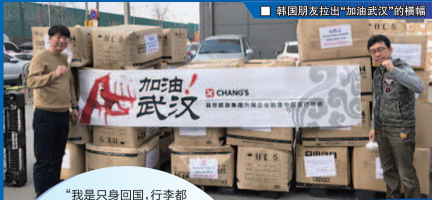
■ 韩国朋友拉出“加油武汉”的横幅