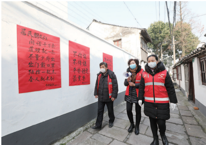
金泽镇金溪居委会用土话喇叭广播,并贴红海报宣传防疫