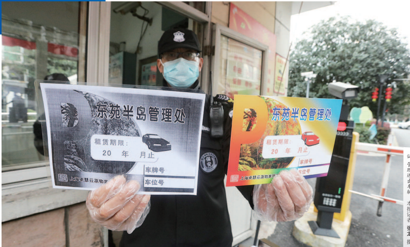
闵行区东苑半岛小区自制双色停车证,管理进出车辆