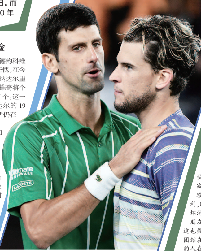
■ 蒂姆何时能破大满贯冠军荒