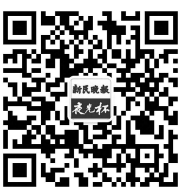
扫一扫，关注“夜光杯”

随着冒着热气的蛋饺不断地出勺，一个个整齐排在盆里，还闪着一团金黄色的喜气，所有人都眉开眼笑。