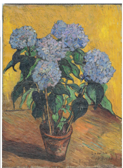
■ 1934 刘海粟 《蓝绣球花》于 杜塞尔多夫