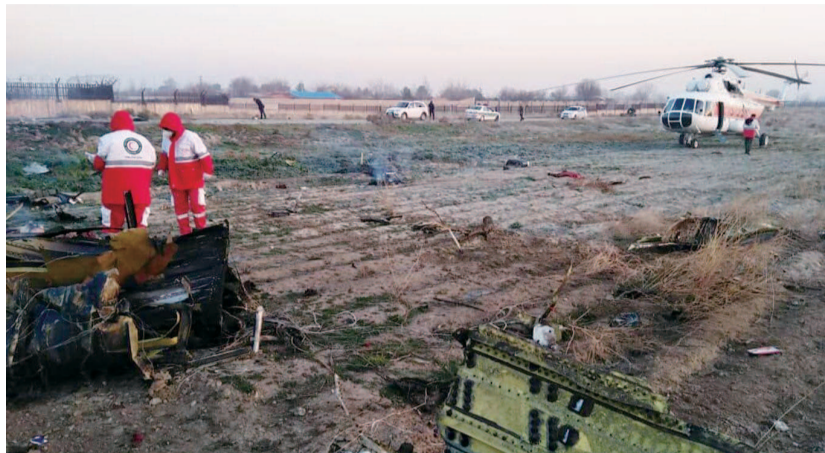
伊朗方面清理乌航客机坠毁现场残骸