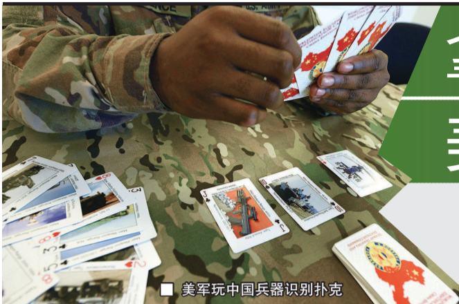
■ 美军玩中国兵器识别扑克