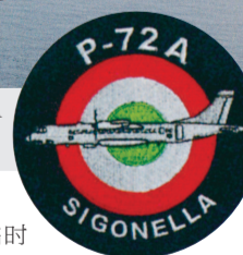
◀ P-72A 巡逻机的驾驶舱 ▶ 意大利 P-72A 与 ATR-72-600 客机无异 巡逻机中队标识