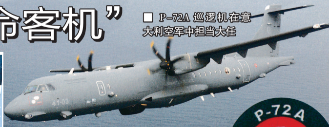
■ P-72A 巡逻机在意大利空军中担当大任

人员培训方面,意军为每架 P-72A 准备了 2 名飞行员、1 名战术协调员、4 名电子操作员和 2 名观察员。其中,大部分机组成员都安排由民航公司的训练中心完成理论学习、模拟驾驶和实际飞行等课程,部队只负责对机组人员进行海上侦察、搜救执行和航电设备使用等第