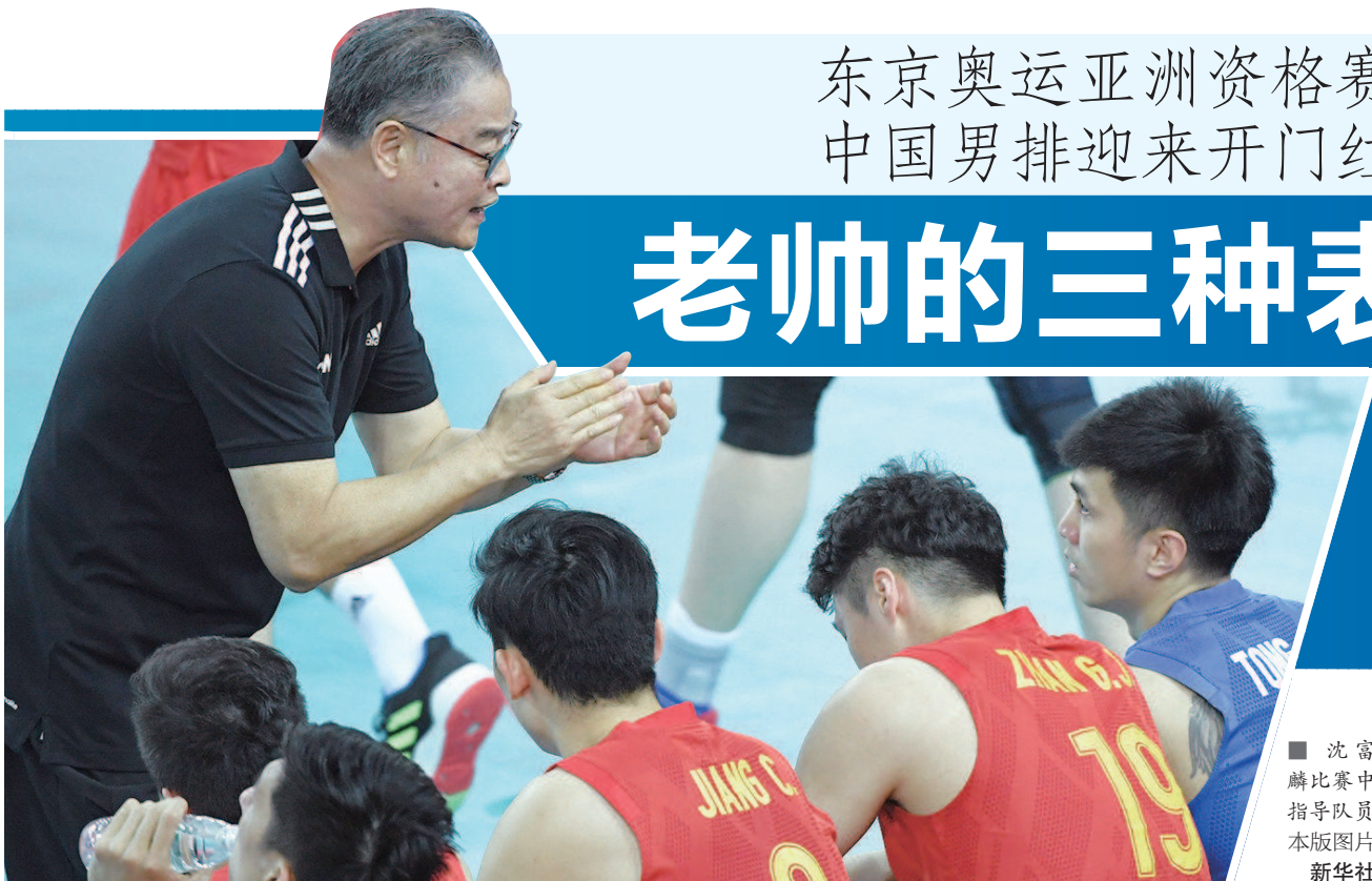
■ 沈富麟比赛中指导队员