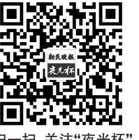
扫一扫，关注“夜光杯”