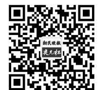
扫一扫,关注“夜光杯”

静默是所有故事的归宿 那些过往渐次模糊 晨霜收起浪漫的舞步 风起别园,转场另一个剧目