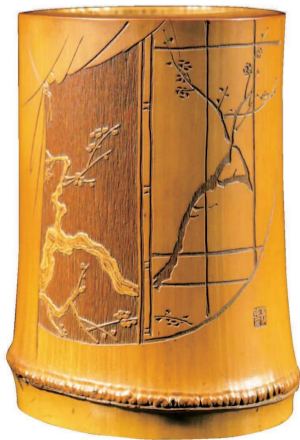
■ 留青阴阳金城画梅窗图竹笔筒