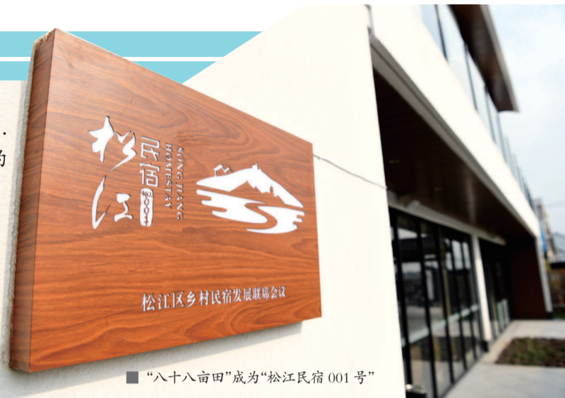
“八十八亩田”成为“松江民宿001号”

就在上月,松江区首张乡村民宿经营许可铭牌发放,“八十八亩田”成为了“松江民宿001号”。这座民宿有什么独特魅力?它为什么能够成为松江第一家“有身份”的民宿?近日,记者前去一探究竟。