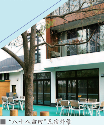
“八十八亩田”民宿外景

未来,松江区将加快促进乡村民宿发展,打造既保持乡村传统风貌、体现当地生活特色,又能为市民游客提供住宿、餐饮、农副产品展销等旅游体验的民宿产品。