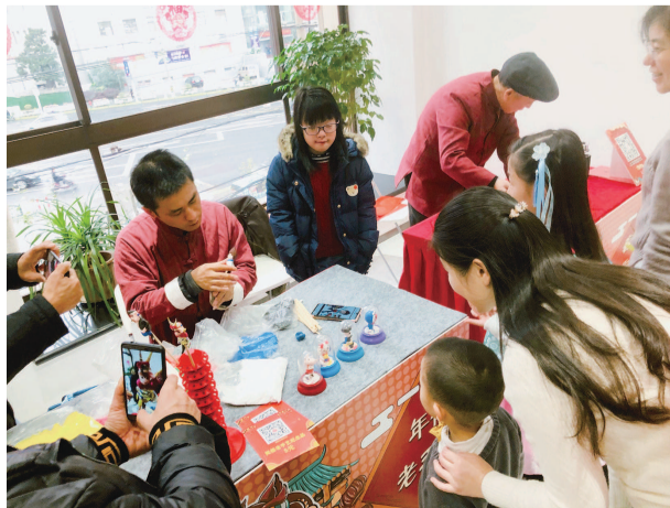
■ 市集还特邀年俗老手艺人带来捏面人等精彩表演

下,对本组范围内的商户门前环境卫生状况进行日常自测自查,并对门前存在乱搭乱建、乱堆乱放、乱设摊点、乱拉乱挂、乱贴乱写乱画、乱扔乱吐等“六乱”卫生状况的商户,进行制止,督促整改。同时,对那些“门责制”工作出色的联盟小组和商户,在镇市容所的指导下,进行推广、表彰。镇政府“门责制”日常工作巡查小组,也将组织管理、执法、作业部门人员和第三方力量及联盟成员一起,联合对沿街商户自治管理情况进行日常巡查、治理。