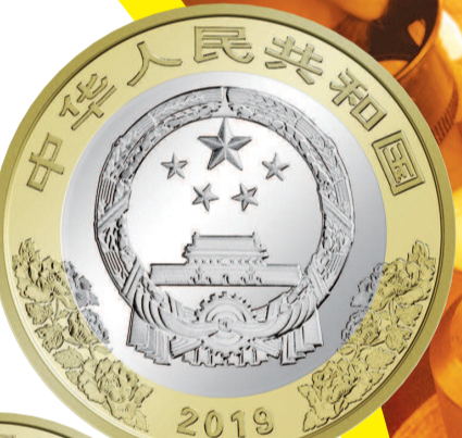
▶ 周年普通纪念币正反面(中华人民共和国成立七十)

2008年,由上海造币制作的北京奥运会“金镶玉”奖牌和奥运系列纪念币,在奥运历史上留下了浓墨重彩的一笔。奥运系列纪念币方面,在图稿设计上,经北京奥组委评审中标的40幅纪念币设计图稿中,有30幅出自上币人之手;在生产规模上,上币成为生产奥运贵金属纪念币全部规格品种的唯一单位;在科研攻关上,上币攻克了“隐形图纹效果”“坯饼表面处理及嵌腐”等一系列工艺难题,填补了生产铜合金材质纪念币的空白;在生产创新上,上币成功制作了奥运历史上最有分量的贵金属纪念币——10公斤奥运金币。