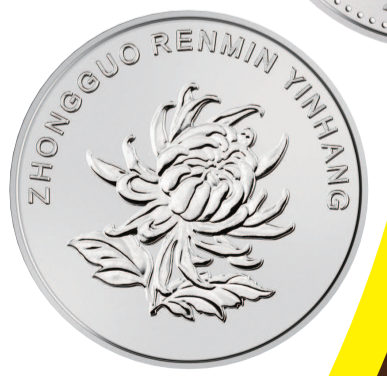
■ 2019年版第五套人民币1元硬币(正反面)