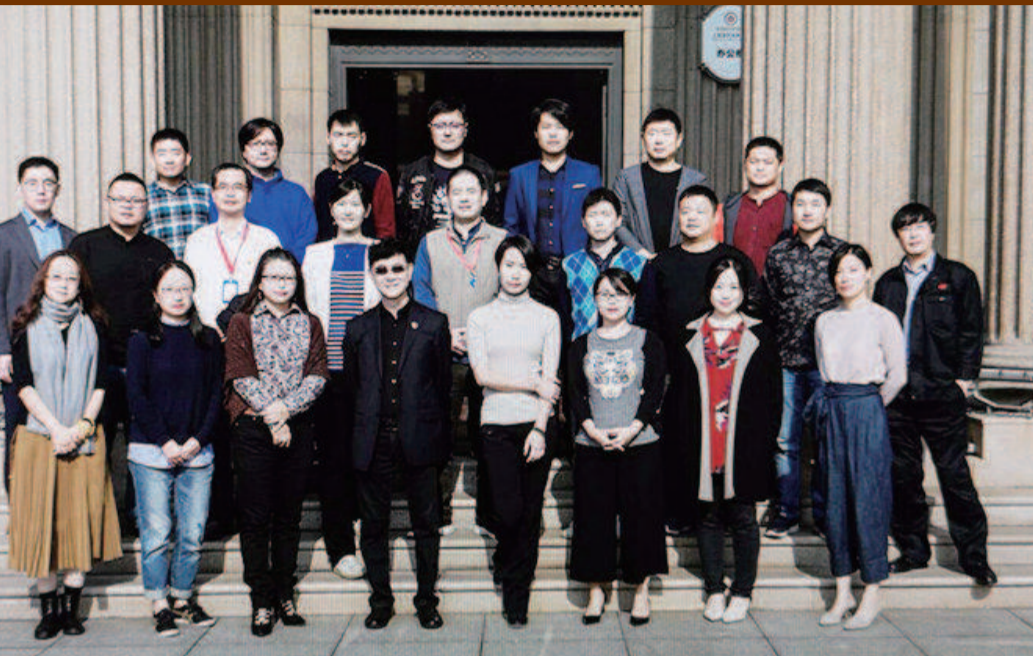
■ 设计团队

最近,泰山纪念币“火”了,不仅是因为其“圆角正方形”的造型,更是因为其国泰民安的美好寓意,是对于过去的2019年很好总结,也是对于新的一年的美好祝愿。而这枚泰山纪念币的设计方——上海造币有限公司硬币设计开发团队,更被誉为是中国钱币设计的“梦之队”。