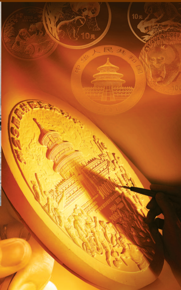
■ 熊猫金银币在国际上发售,获广泛好评