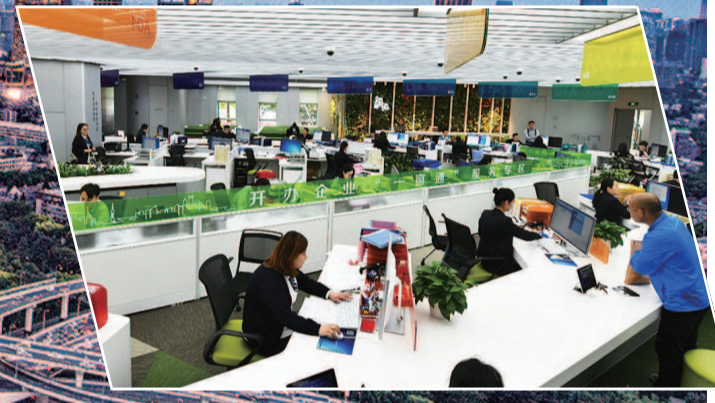
“一网通办”越来越“像网购一样方便”