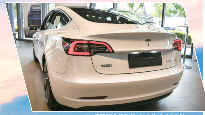
首批国产特斯拉以“上海速度”交付

答好营商环境考卷，最根本的还是看社会评价和企业感受。改革措施千万条，企业感受第一条。岁末年初，三名企业人员吐露了不少心声。