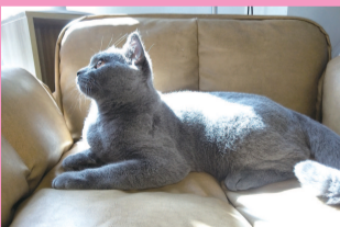
坐在沙发上晒太阳想心事